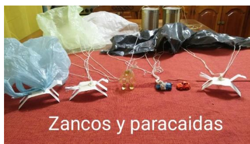
Zancos y paracaídas