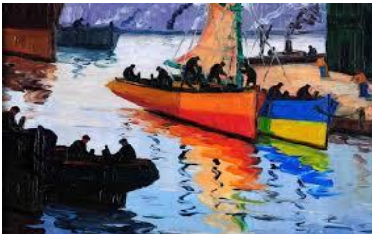
Pintor: Benito Quinquela Martín