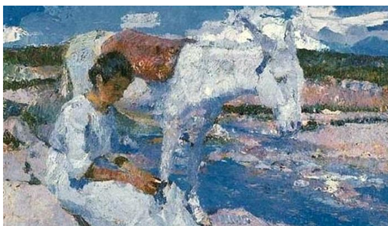
Pintor: Fernando Fader