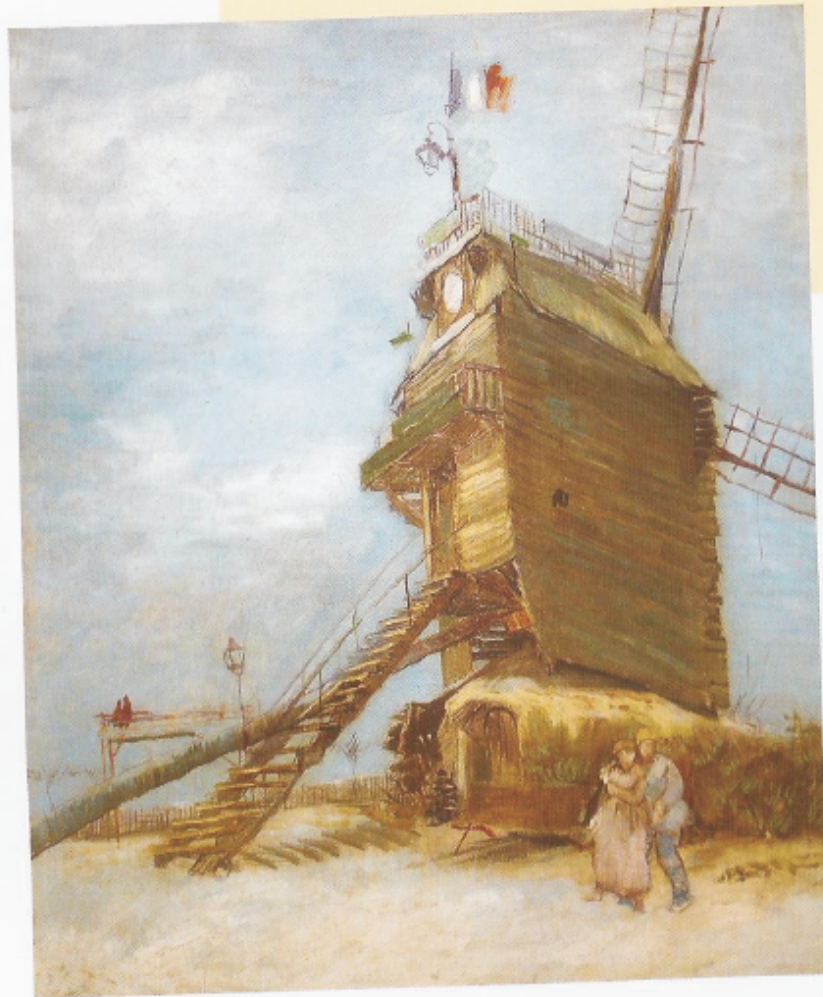
El Molino de la Galette

Después de mirar muchos cuadros, Vincent se puso a trabajar. Primero pintó lo que veía desde su ventana (y lo pintó con puntitos como Seurat). Después salió con su caballete y su paleta a pintar el paisaje de Montmartre, con molino y todo.