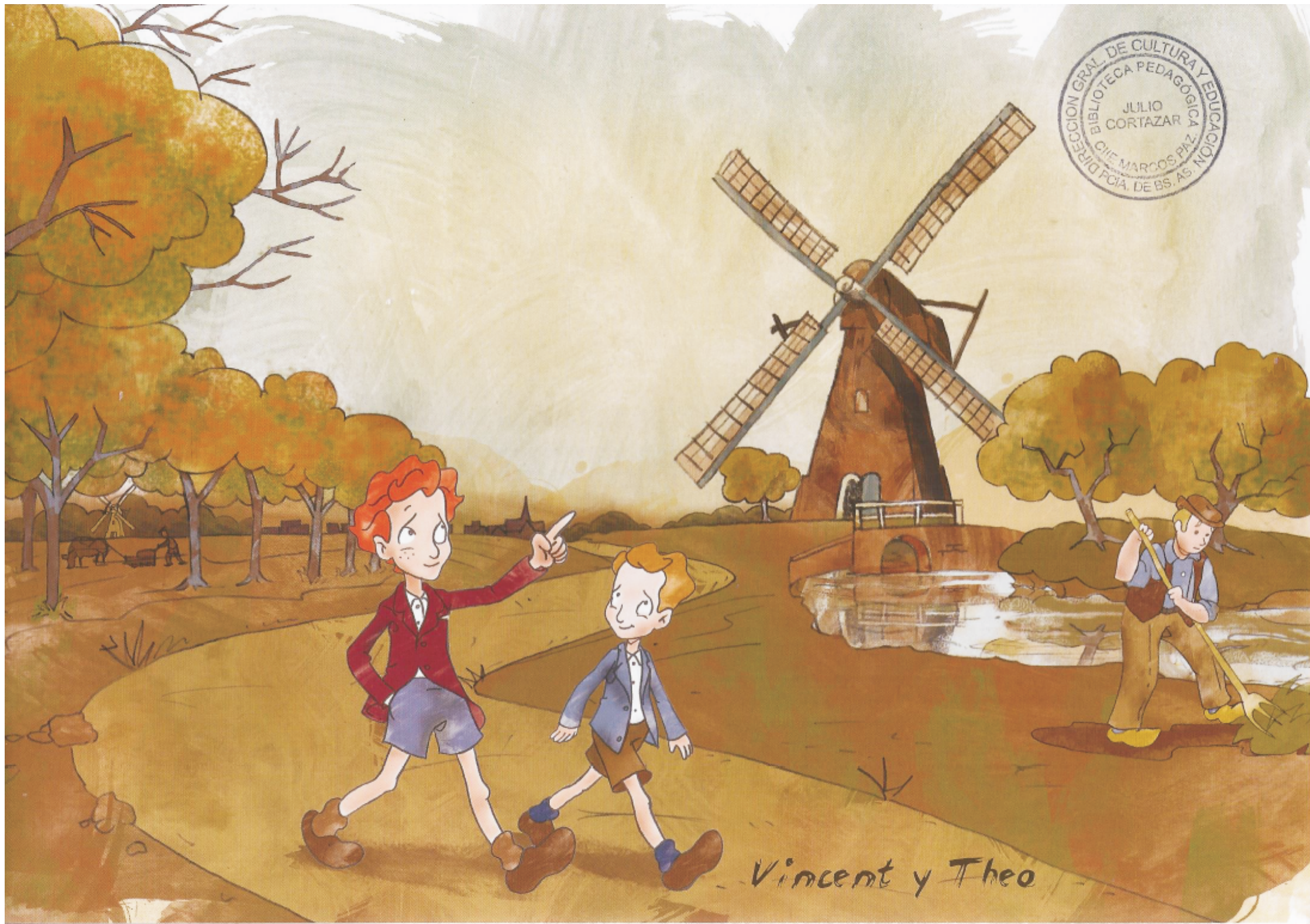
Vincent y Theo